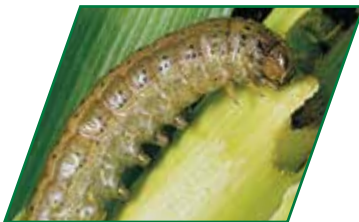
Ataque de larva desarrollada al cogollo